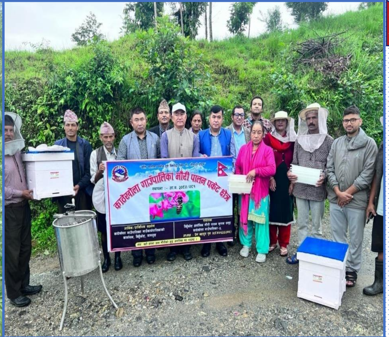
आलु तथा मौरी पालन पकेट कार्यक्रमको अनुगमन तथा सामाग्री वितरण