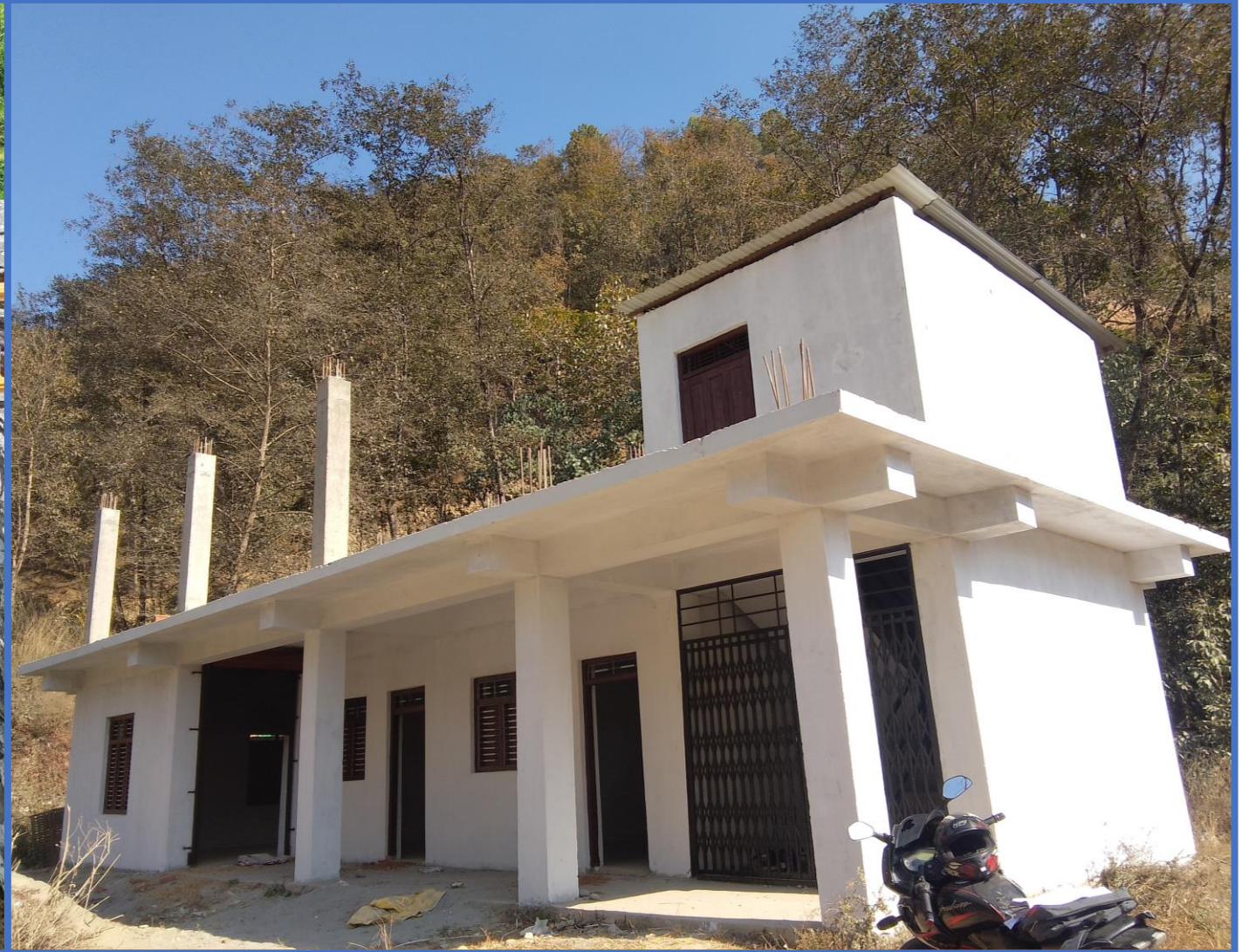
अक्षेते हाट बजार भवन