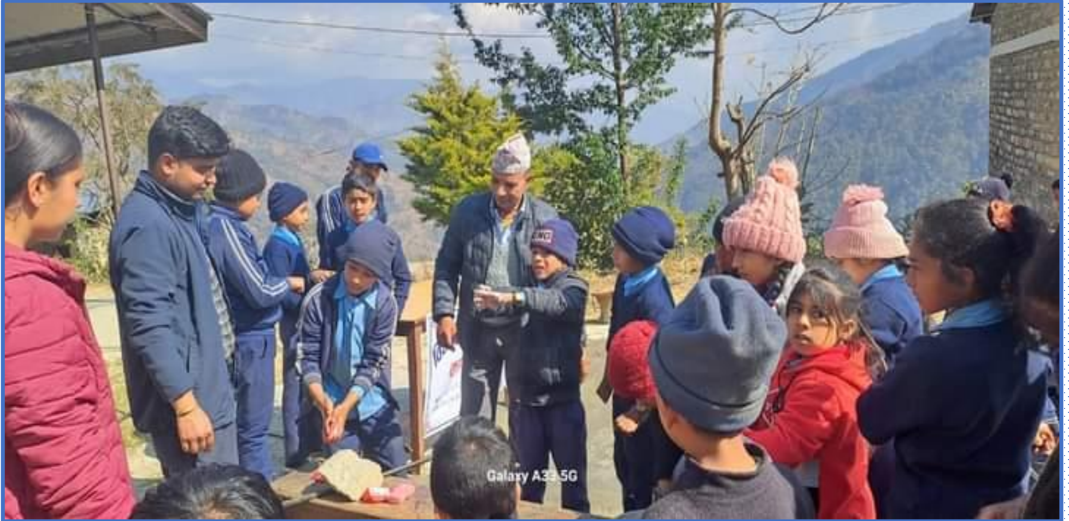
विद्यार्थीहरूमा स्वास्थ्य सम्बन्धी जानकारी