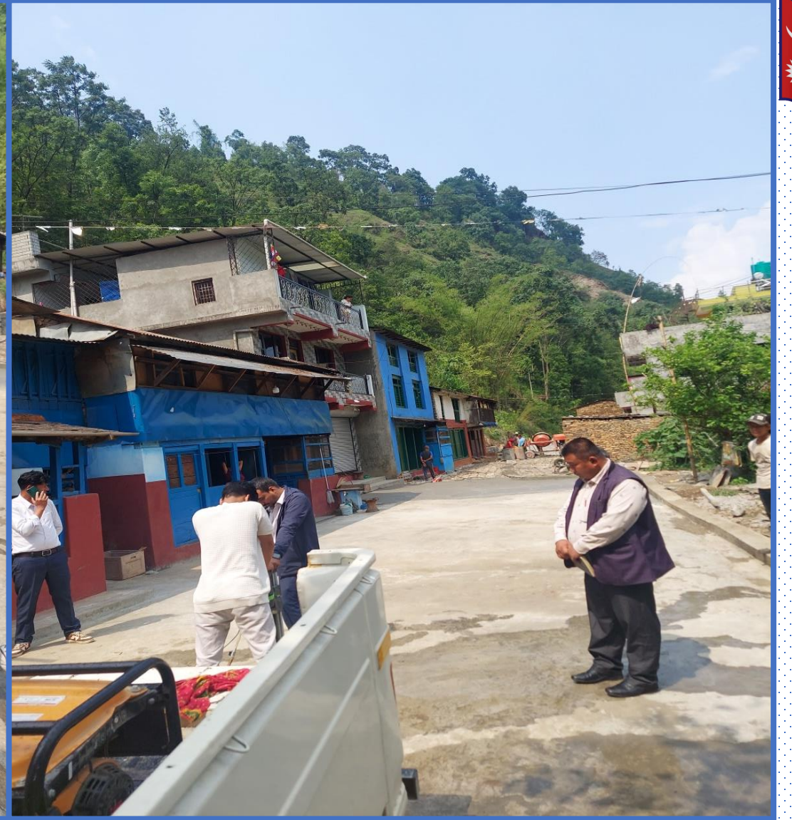
एकपाटे दोविल्ला सडक स्तरोन्नती