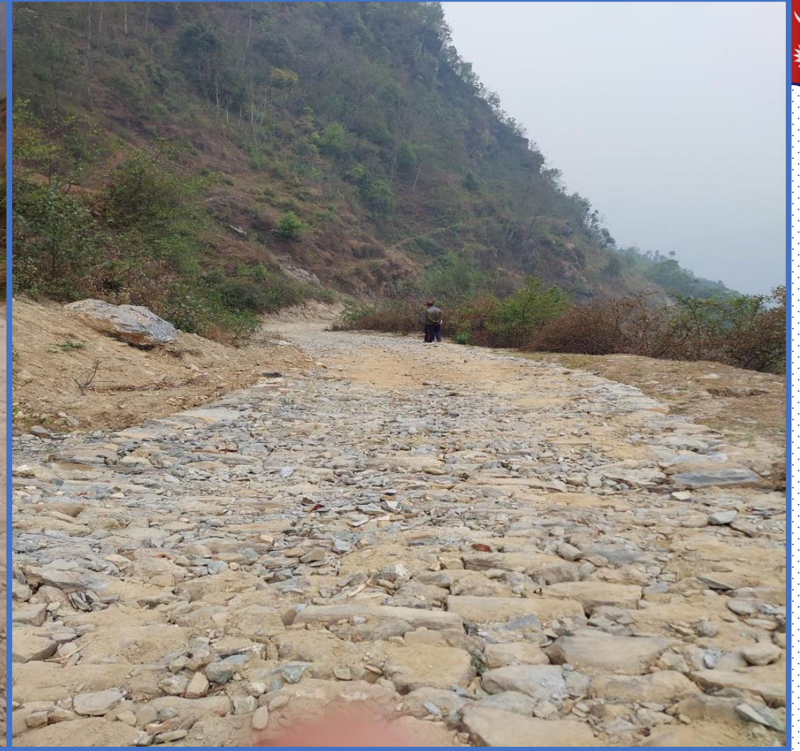
भिमापोखरा मोटरबाटो सोलिड तथा ढलान