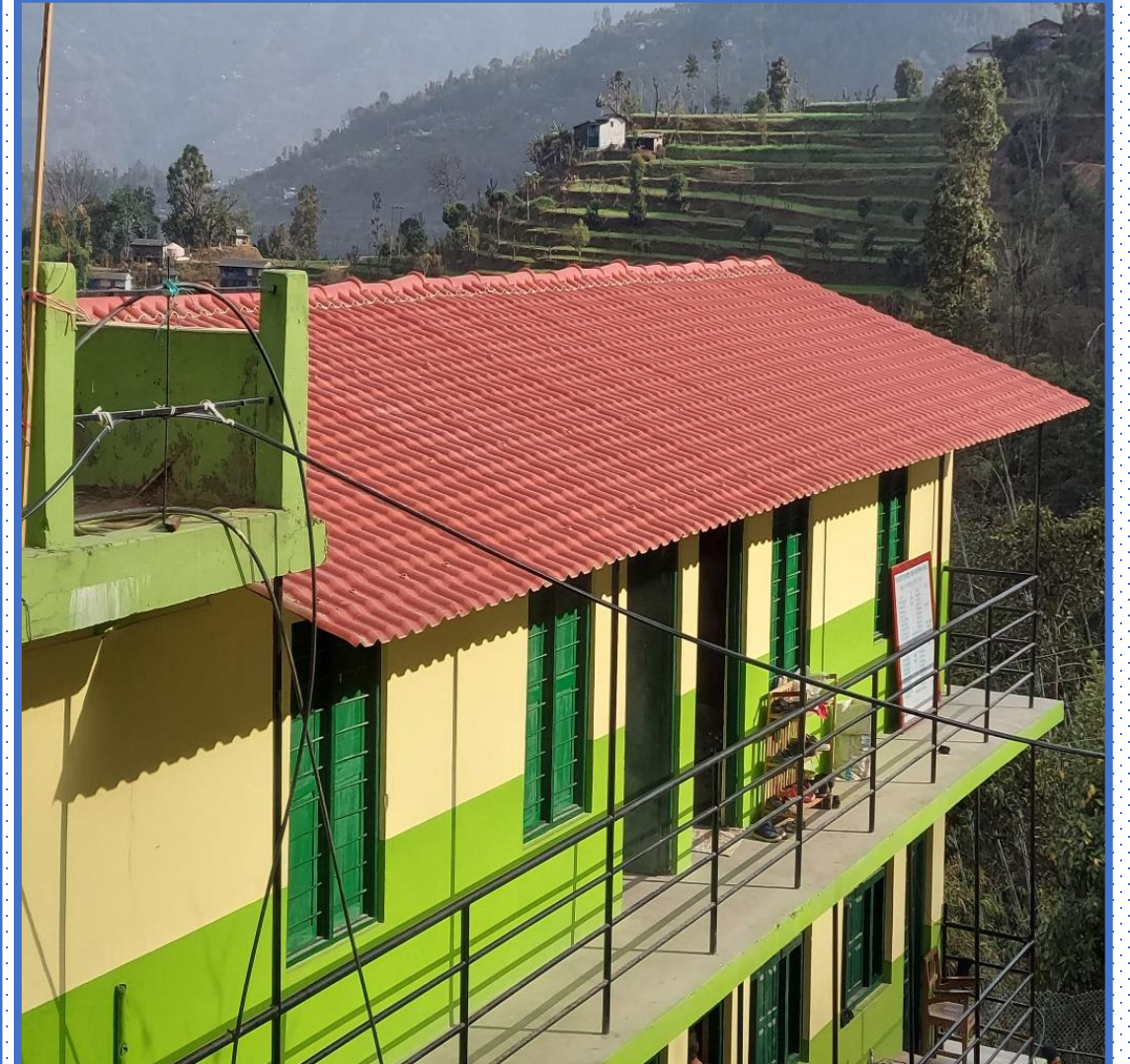
निर्मल आ.वि. धम्जाको ढलान र नारायणी मा.वी. भवन मर्मत